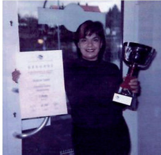
Frau Turan mit dem Siegerpokal des "Super-Star"

Als Bildvorlage diente ein Foto von Paris Hilton, der Urenkelin des Hotelgründers Conrad Hilton.